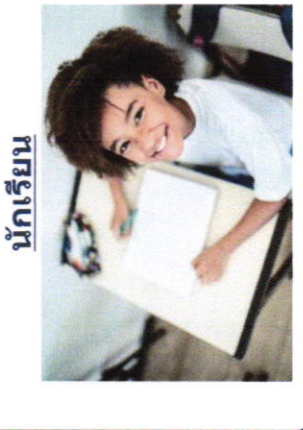
นักเรียน