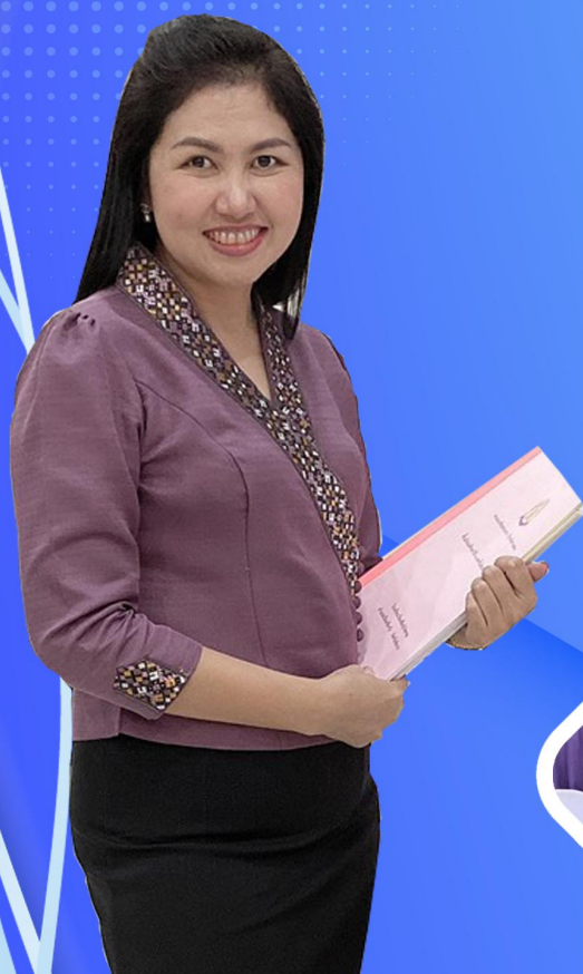
นางสาวbahยັນ ดงชู

ศึกษานิเทศก์กลุ่มงานวัดและประเมินผลการศึกษา