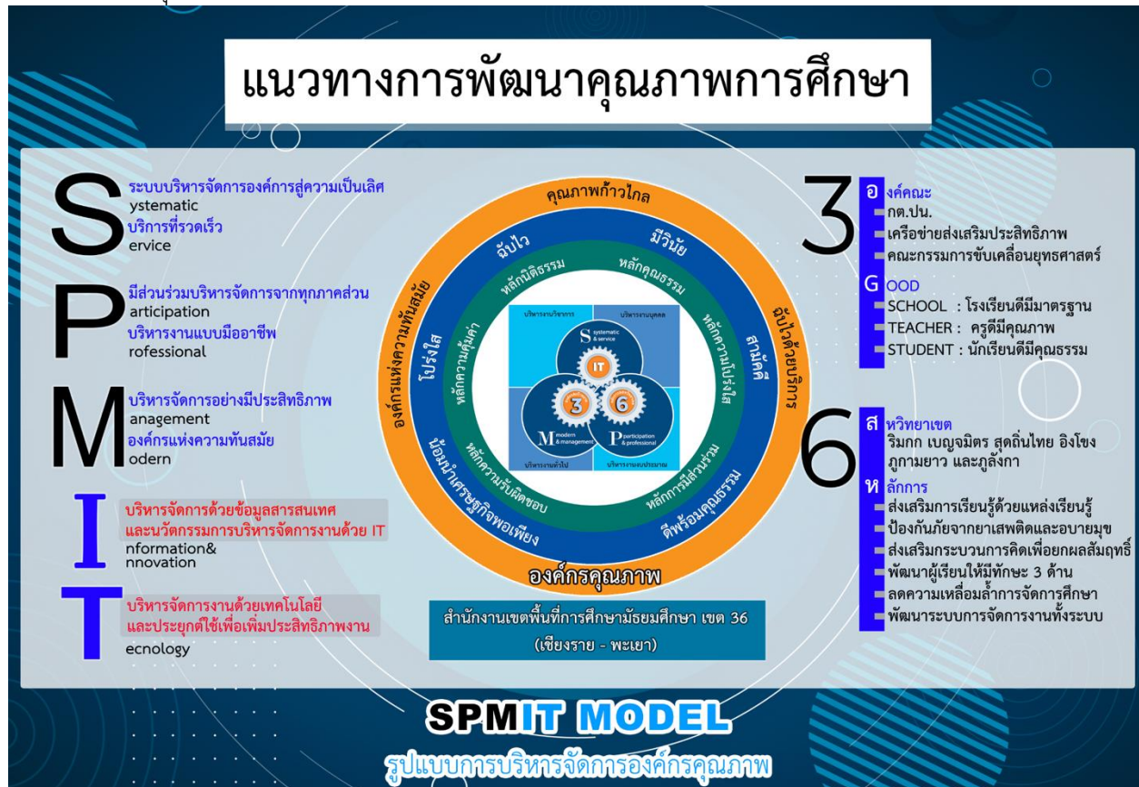
ภาพที่ 1 รูปแบบการบริหารจัดการองค์กรคุณภาพ

เมื่อมองถึงวิถีและมิติความสัมพันธ์ในการปฏิบัติงาน การนิเทศเชิงระบบเป็นการนิเทศที่อาศัยความเชื่อมโยงสัมพันธ์ระหว่างผู้นิเทศ (ศึกษานิเทศก์) กับหน่วยงาน องค์กร บุคลากร ตลอดจนปัจจัยอื่นที่มากกว่าหนึ่งมิติ มีการปฏิบัติงานทั้งโดยทีมสัมพันธ์ และรายบุคคล ประการสำคัญต้องมีความรับผิดชอบในการปฏิบัติงาน มุ่งเน้นสัมฤทธิ์ผลของหน่วยงานเป็นสำคัญซึ่งแสดงมิติความสัมพันธ์ในการปฏิบัติงาน โดยมีแนวทางการพัฒนาคุณภาพการศึกษาดังภาพ